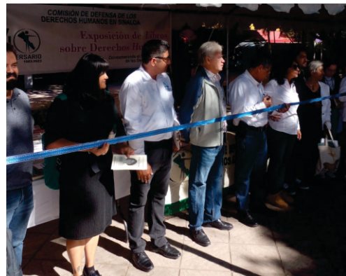
Expo Libros de Derechos Humanos