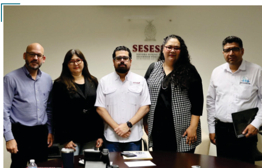
Reunión de trabajo con el Secretariado Ejecutivo del SESEP