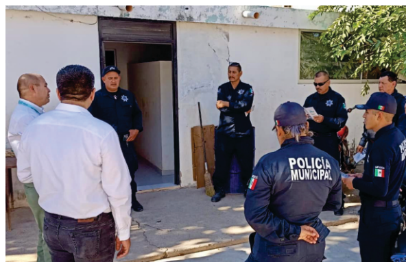
Capacitación a servidores públicos de Sinaloa de Leyva