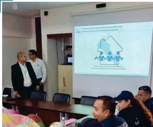
Capacitación a servidores públicos de Choix