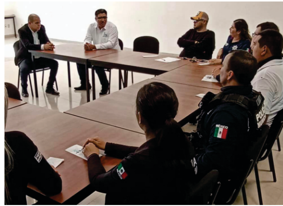
Capacitación a servidores públicos de El Fuerte