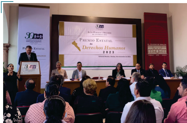
Entrega del Premio Estatal de Derechos Humanos 2023