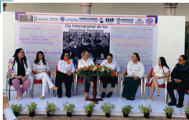
Conferencia: Derechos de la Mujer, en el marco del Día de los Derechos Humanos

activismo, asistiendo a eventos externos y organizar diferentes acciones al interior de este instituto.