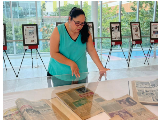
Exposición “50 años de historia periodística”