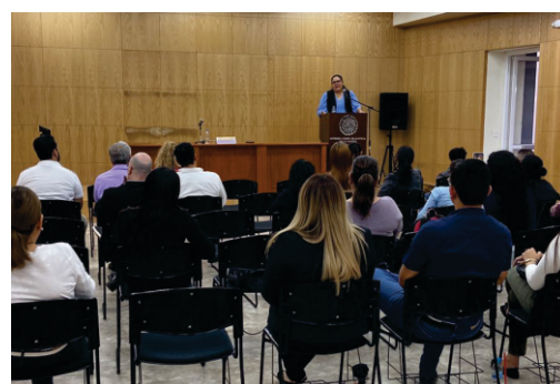
Conferencia: Principio Pro Persona