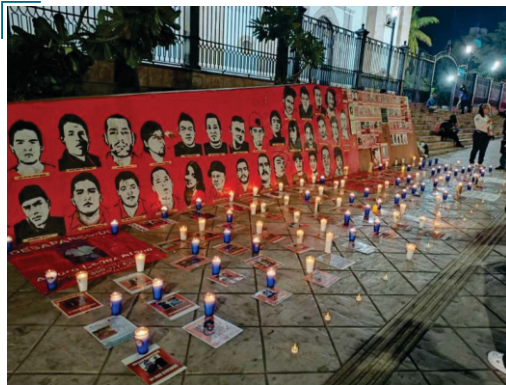
Evento “Avanzando por la Verdad”