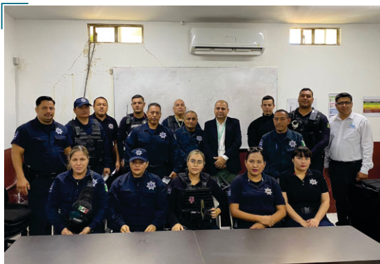
Capacitación a servidores públicos de Ahome