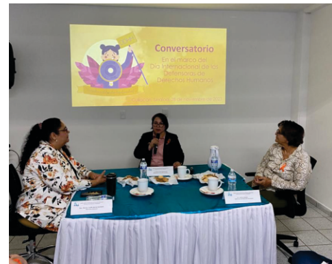
Conversatorio en el marco del Día de las Defensoras de Derechos Humanos

Otras acciones realizadas en redes sociales durante los 16 días de activismo: